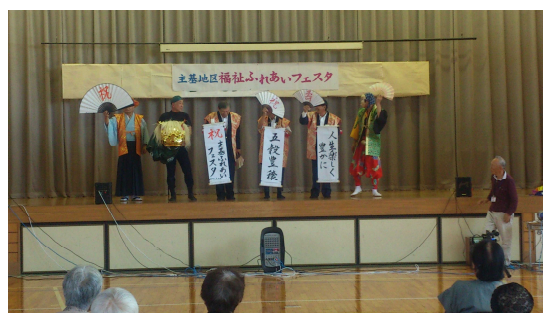
主基青空サロン (成川・北小町・南小町・上小原 下小原合同サロン)