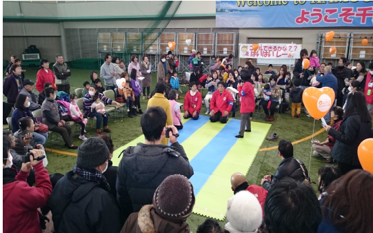
福祉フェスティバル はいはいレース

内 容 「子育てシンポジウム」「はいはいレース」「ベビー用品交換会」「福祉バザー」「KIDS サッカー教室」「活動紹介コーナー」「フードコーナー」ほか 参加者 700人