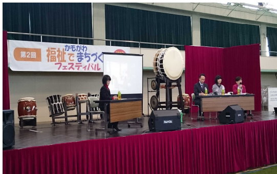
福祉フェスティバル 子育てシンポジウム