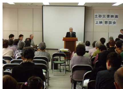
天津地区社会福祉協議会 防災懇談会