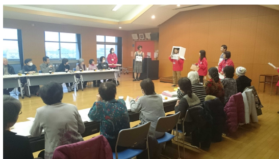
市社協主催 サロン交流会