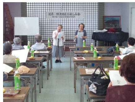
鴨川第一地区社会福祉協議会 お楽しみ会