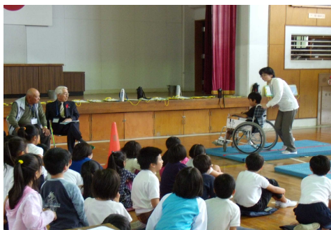
西条小学校福祉教育