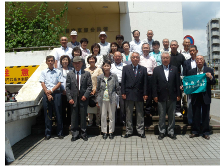
東条地区社会福祉協議会 船橋市前原地区視察