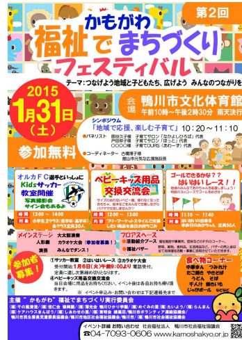
福祉フェスティバル ポスター