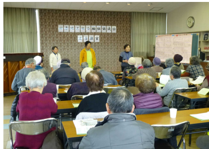
田原地区社会福祉協議会 見て聞いて食べる健康教室