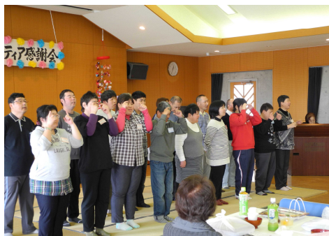
ボランティア感謝祭