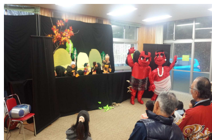
大山地区社会福祉協議会 グリーンアドベンチャー