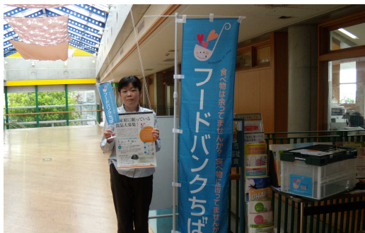
フードドライブ事業 への協力協力