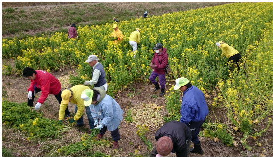
東北へ菜の花を送ろうイベント