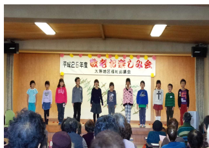
太海地区社会福祉協議会 お楽しみ会