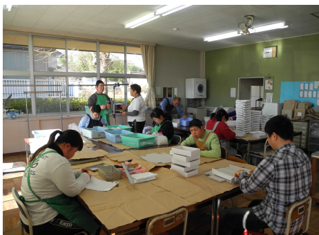
福祉作業所 作業訓練