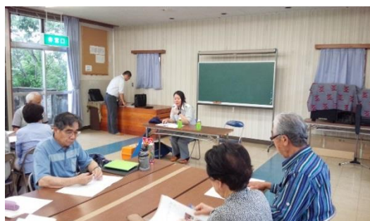
研修会「高齢者のもしもの時の対応」