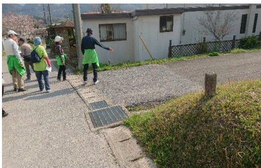
フィールドワーク「地域を歩く」 (大山地区)