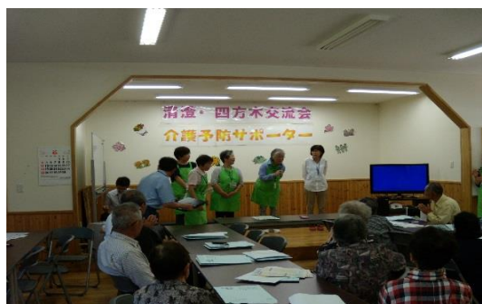
清澄・四方木交流会（天津小湊地区）