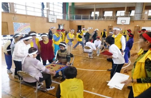
江見地区合同サロン「老輪ピック」 (江見地区)