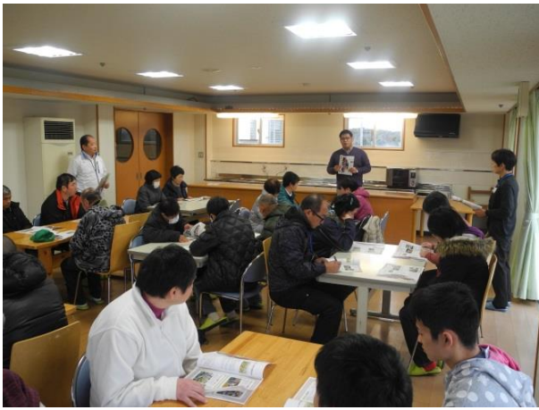
施設見学（中里ワークホーム）