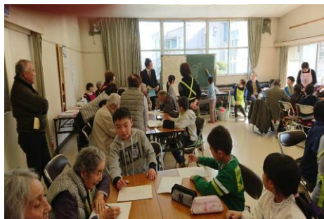
ふれあいサロン田原（田原地区）