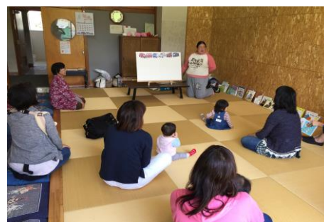
子育てサロンなかよし広場（大山地区）