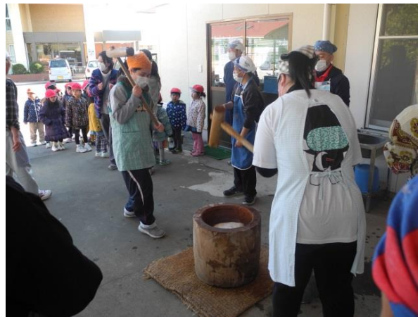
餅つき大会（西条こども園児と）